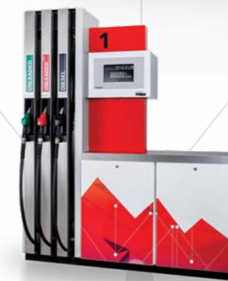
OCEAN Line CUBE