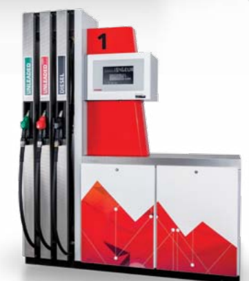
OCEAN Line FIN